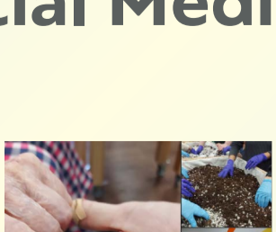
Ελληνικό Φόρουμ Μεταναστών