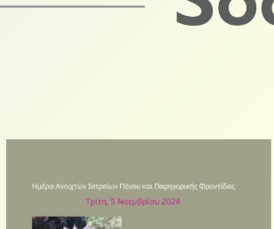
Ημέρα Ανοικτών Ιατρείων Πόνου & Παρηγορικής Φροντίδας 2024