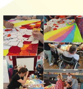
«Όσα δημιουργεί η καρδιά»