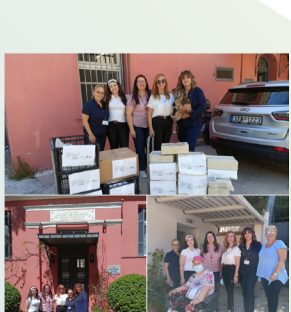
Στο πλευρό μας ο Όμιλος ΙΑΣΩ