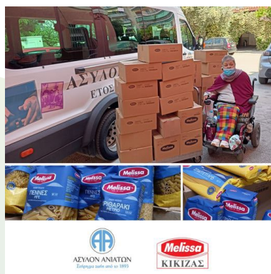
Στο πλευρό του Ασύλου Ανιάτων η εταιρεία ΜΕΛΙΣΣΑ ΚΙΚΙΖΑΣ Α.Β.& Ε.Ε. ΤΡΟΦΙΜΩΝ