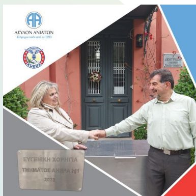
Δωρεά από την οργάνωση ΑΝΕΡΑ και το τμήμα Athens Chapter ΗΨ001