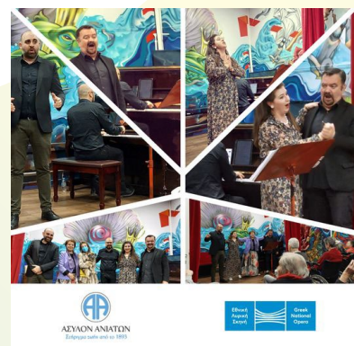
Καλλιτέχνες της Εθνικής Λυρικής Σκηνής στο Άσυλο Ανιάτων