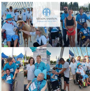
Συμμετοχή στον αγώνα δρόμου LIFELINE RUN