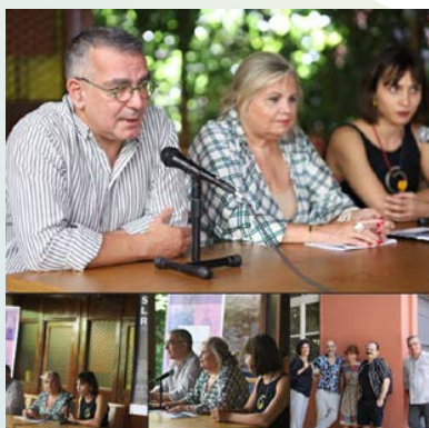
Παράσταση Solaris στο Άσυλο Ανιάτων